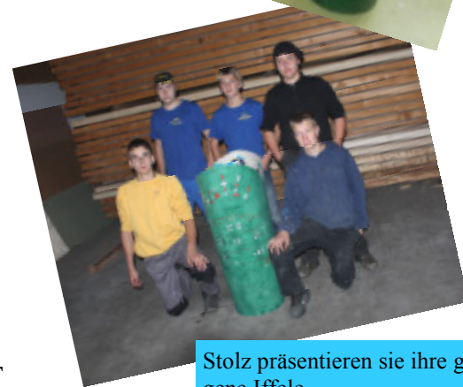
Stolz präsentieren sie ihre gelun-gene Iffele.